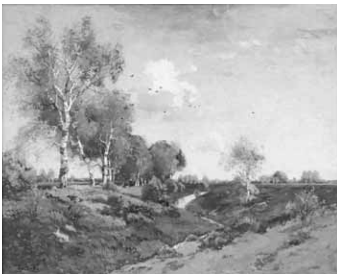
Theophile de Bock, De beek bij Wolfheze, 1897, olieverf op doek, 98 x 122,5 cm, collectie Kunsthandel Bies, Eindhoven.

Théophile de Bock overlijdt op 22 november 1904. Piet van Walchren, bestuurslid van Pictura Veluensis, voert het woord namens de vereniging tijdens de bijzetting van het stoffelijk overschot in het mausoleum te Haarlem.