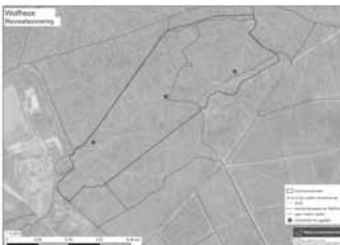
Dit is de kaart die de aanpassing van de recreatiezonering weergeeft. Voor meer detail: kijk op www.natuurmonumenten.nl/natuurgebieden/wolffheze/nieuws/aanpassing-wandelpaden-in-hoog-wolffheze

De veranderingen passen in de lijn van het Recreatiezoneringsplan Veluwe van de Provincie Gelderland. De Veluwe is een prachtig natuurgebied, met haar rijke natuur en variatie aan landschappen. Recreanten komen er graag om van de prachtige natuur te genieten. Dat willen we graag zo houden. Daarom zoeken we naar een nieuwe, betere balans tussen de ruimte voor de natuur en de mens. Want de natuur op de Veluwe gaat achteruit. Een van de oorzaken is versterking door recreatie, verkeer en evenementen. Vooral in kwetsbare delen van de Veluwe hebben planten en dieren hieronder te lijden. Zo erg zelfs dat sommige soorten van de Veluwe dreigen te verdwijnen of uit te sterven met als risico dat we de soortenrijke natuur op de Veluwe kwijtraken.