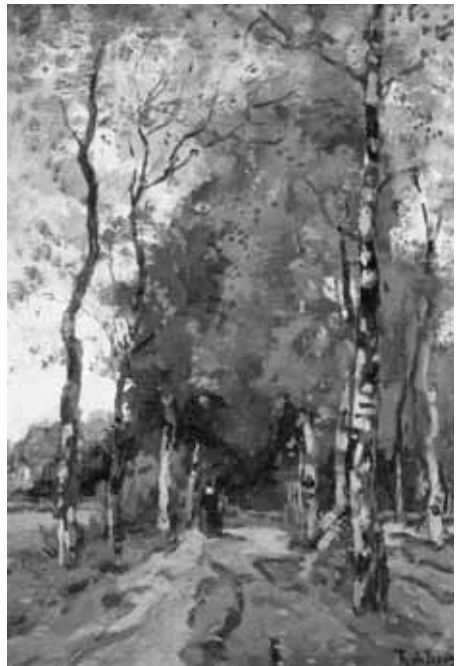
Théophile de Bock, Zandweg met berken, olieverf, 41,5 x 27,5 cm, collectie Museum Veluwezoom Doorwerth

De vereniging heeft onder andere als doelstelling de belangstelling voor de beeldende kunst in de regio te bevorderen en de samenwerking tussen de in Renkum en Heelsum wonende kunstenaars te versterken. Dit wordt bewerkstelligd door het organiseren van zomertentoonstellingen en het samenstellen van verkoopportefeuilles met aquarellen, tekeningen en grafiek, die in de winter circuleren langs andere kunstenaarsverenigingen in Nederland. Ook worden tekenavonden, lezingen, voordrachten en muziekkuitvoeringen georganiseerd.