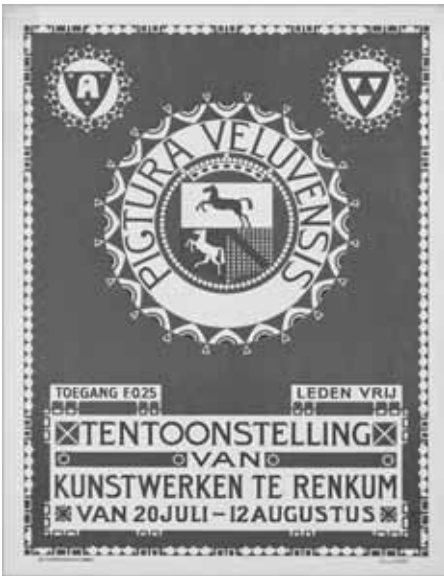
Affiche van de zomertentoonstelling van Pictura Veluensis, lithografie, formaat en verblijfplaats onbekend.

Bock is verkocht ten bate van de bewaarschool.' Er waren 300 betalende bezoekers en ook werden er verschillende andere werken verkocht. Aan het einde van de tentoonstelling kon voor een nieuwe inrichting van de school een bedrag van f 421,51 geschonken worden. Een ongekend goede afloop van een tentoonstelling in zo'n klein dorp.