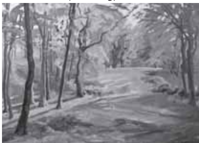
Bart McLeod (vandaag)

Wordt vrijwilliger bij de Pelshoeve in de rol van gastheer/gastvrouw. Ervaring is niet vereist; alleen een goed humeur kunnen we zeer waarderen. Bezoekers komen voor de tuin, het huis en een kopje koffie. Ieder weekend is er een activiteit zoals workshop, lezing, film, wandeling of muziek. Meld je aan via veluwezomer.nl . Het is een informele, aantrekkelijke omgeving. De expositie loopt op twee verdiepingen en in de tuin. Open: op vrijdag, zaterdag en zondag van 11:00 tot 17:00 uur.