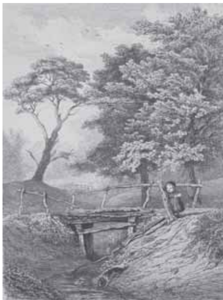
Handgekleurde ets van de heide van Wolfheze met links de Duizendjarige Den, door Pierre Louis Dubourcq, 1856.

andere bekende dennen uit zijn tijd, zoals de Wonderboom van Zeist of