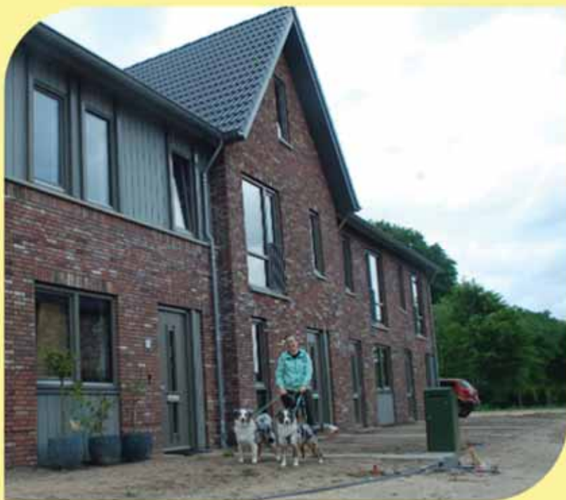
De allereerste bewoners van de Bovenheide: Romy, Louis en de honden Freckles en Sproetjes (Louis staat niet op de foto)